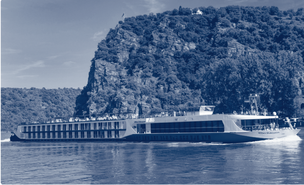
Mit der Flusskreuzschifffahrt hat sich Basel längst zum bedeutendsten europäischen Hub entwickelt