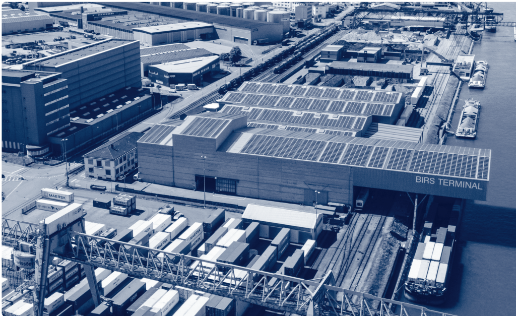
Birsterminal AG in Birsfelden. Die trimodale und multifunktionale Logistikplattform bewirtschaftet mit 90'000 m 2 die grösste zusammenhängende Fläche in den Basler Rheinhäfen.

ter zu leiden. Die verarbeitende Industrie konnte sich nicht mehr auf das Anlieferprinzip «Just in time» verlassen und kauft seither auf Vorrat ein, was zu kriegen ist und mietet bei uns Lagerflächen an. Dieses Geschäft boomt.